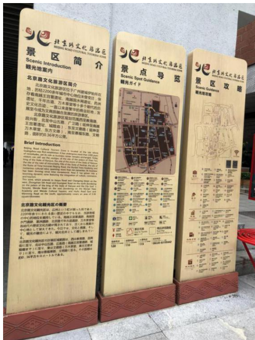
北京路设有智慧导览桩

宝墨园、石头记矿物园、圆玄道观、北京路文化旅游区、荔湾博物馆等景区设计开发了“手机自动导游语音讲解系统”，只要关注景区公众号即可免费使用。