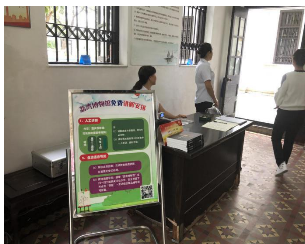
荔湾博物馆内设语音讲解服务