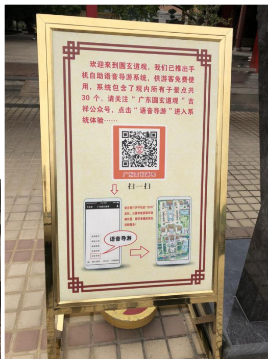
圆玄道观设有手机自助语音导览系统

宝墨园智慧票房系统为游客提供了网络PC端、手机移动端等多种智能购票渠道，只需将手机或纸质门票上的二维码对准闸机感应口，即刻实现3秒购票，1秒入园的体验。