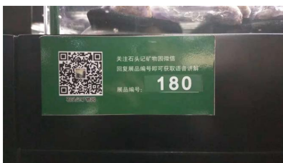
石头记矿物园内的语音讲解