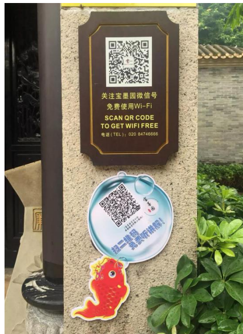
宝墨园设有免费语音讲解服务