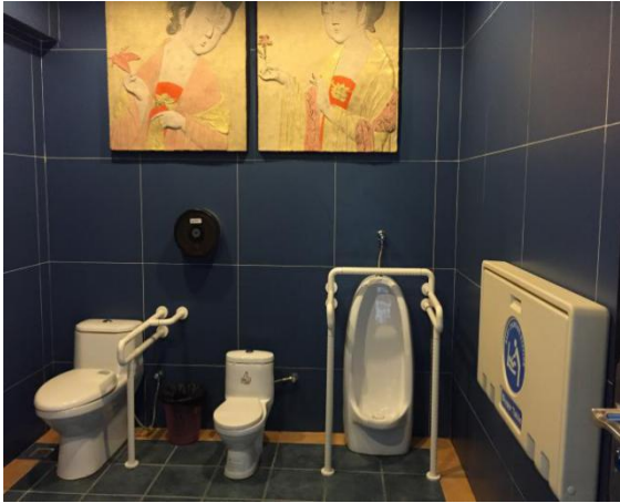
岭南印象园第三卫生间