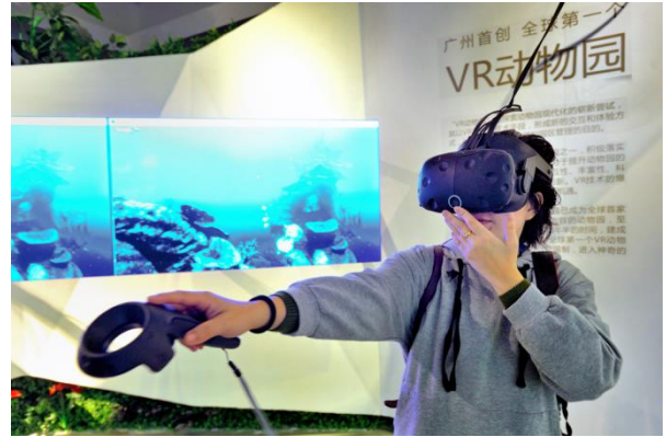
动物园的VR体验受到游客的热捧

陈家祠筹建的数字体验馆，综合运用三维数字投影、虚拟现实和增强现实技术来解读其百余年历史和建筑文化，为游客提供身临其境的参观体验。