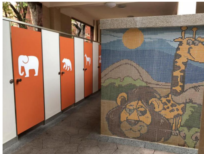
广州动物园将动物形象融入厕所设计中

近年来，广州市积极贯彻落实国家旅游局、广东省旅游局厕所革命工作部署，结合市委、市政府开展的“干净、整洁、平安、有序”城市环境整治工作，全市上下掀起一场轰轰烈烈的“厕所革命”热潮。根据2016年8月实施的国家标准《旅游厕所质量等级的划分与评定》，我市旅游景区对旅游厕所建设工作重视程度日益高涨，旅游厕所硬件设施，服务质量等方面均有全面提升，尤其是在第三卫生间建设方面，启动速度快，设施配套完善，设计建设标准化，管理维护制度化。其中，莲花山、宝墨园、广州动物园、岭南印象园的旅游厕所建设和管理获得市民游客一致好评。