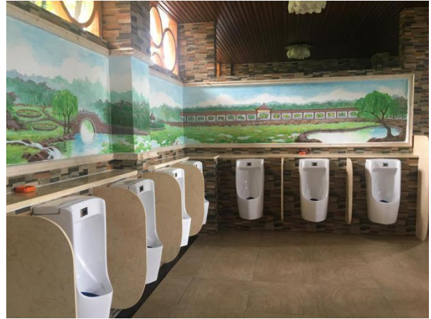
莲花山景区厕所内的员工手绘墙