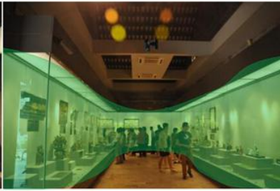
转动式覆盖古建筑内重点监控陈列展柜，对区域进行温度监测。