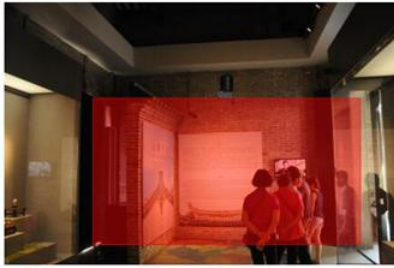
后东斋 固定式安装位置及检测范围（红色） 转动式安装位置及检测范围（绿色）